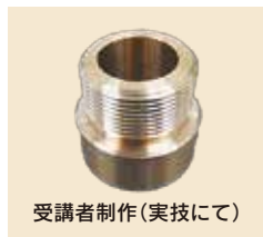
受講者制作(実技にて)